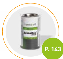
Adhesivo Armaflex HT625

Para asegurar un sistema de aislamiento óptimo.