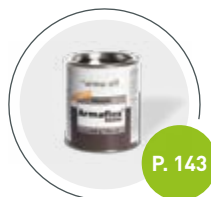
Adhesivo Armaflex RS850