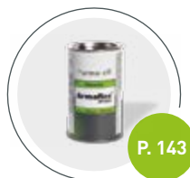
Adhesivo Armaflex HT625