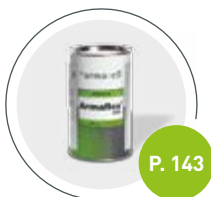
Adhesivo Armaflex 520

Para asegurar un sistema de aislamiento óptimo.