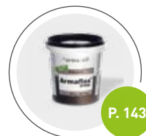
Adhesivo Armaflex SF990