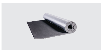
PLANCHAS Planchas en hoja