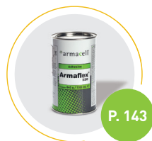
Adhesivo Armaflex 520

Para asegurar un sistema de aislamiento óptimo.