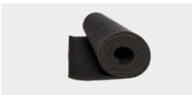
PLANCHAS Planchas en hoja