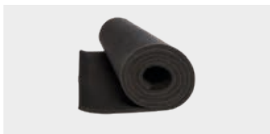
PLANCHAS AUTOADHESIVAS Planchas en hoja Planchas en hoja autoadhesivas