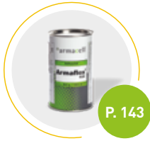
Adhesivo Armaflex 520

Para asegurar un sistema de aislamiento óptimo.