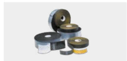
CINTAS Cintas autoadhesivas