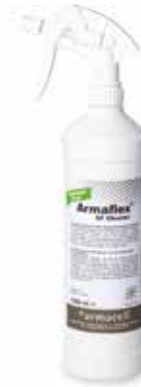
Armaflex SF Reiniger