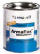
Armaflex Ultima RS850