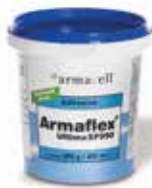
Armaflex Ultima SF990