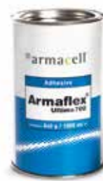
Armaflex Ultima 700