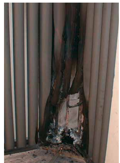
Abbildung 2: Der SBI-Test – hier am Beispiel von elastomeren Schläuchen – vor, während und nach dem Test