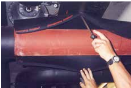
Een van de eerste AF/ArmaFlex installaties die nog steeds in gebruik is.