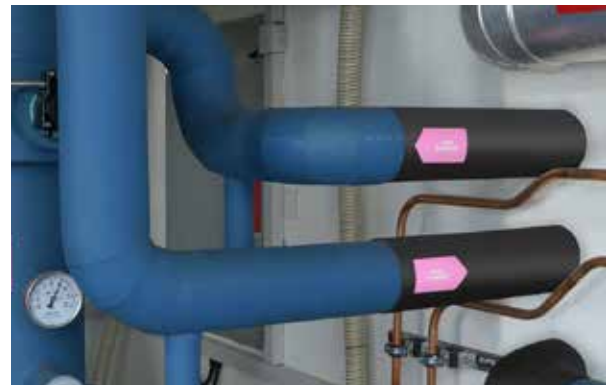
Die einzigartige ArmaFlex Protect Brandschutzlösung kombiniert effektive thermische Dämmung, zuverlässige Tauwasserverhinderung und Reduktion von Körperschallübertragung in einem einzigen Produkt.